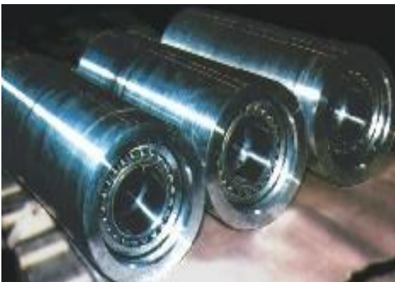
Rodillos separados y camisas