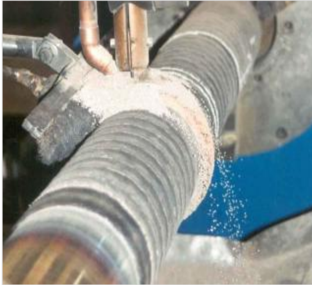
Aspecto del recargue de un rodillo de colada continua