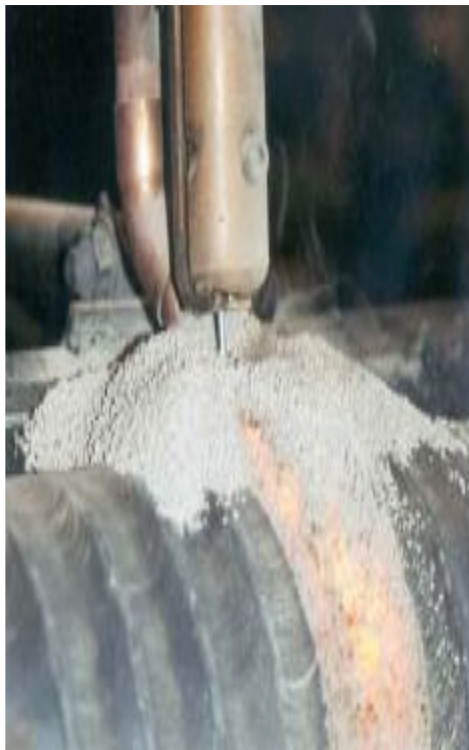
Detalle del cordón protegido por la escoria